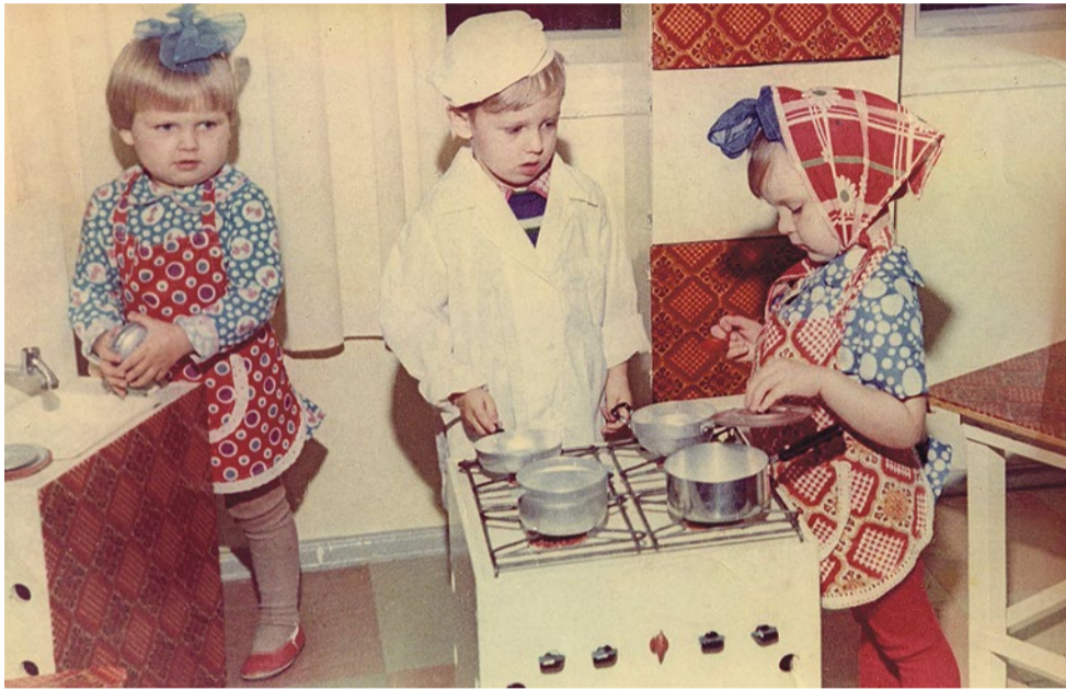
Сюжетные игры. Дети и игрушки, 1980-е годы.

Детский сад № 65 носит имя «Солнышко». Зажглось оно 55 лет назад и, несмотря на все перемены, многие годы светит детям и взрослым.