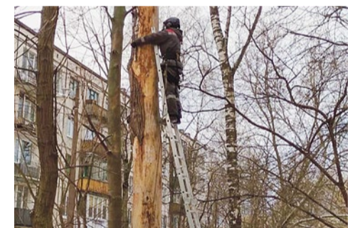
Санитарная рубка деревьев на Софийской улице, 35/4