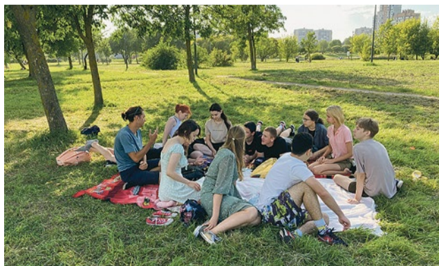
Встреча дискуссионного клуба в парке Интернационалистов