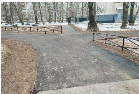
Ремонт подходов к школе № 303 на Софийской улице, 36