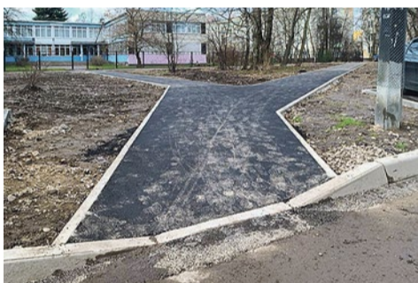
Заасфальтированные дорожки у детского сада № 69 на улице Белы Куна, 17/3