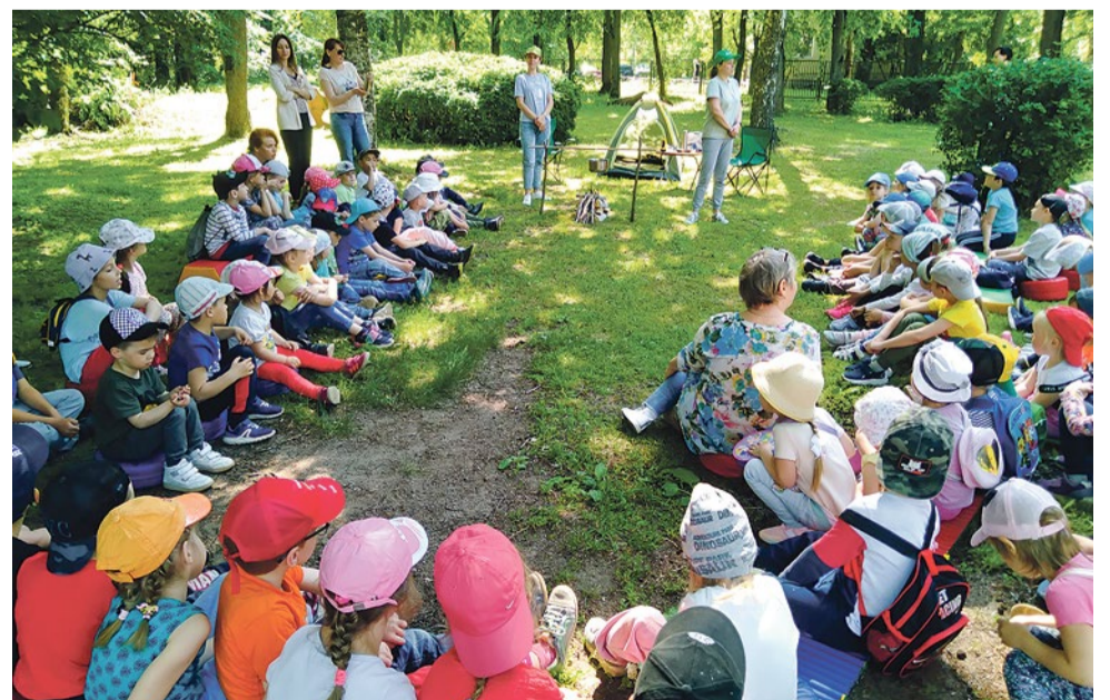
Ежегодный праздник-поход сада «Мы – друзья природы»