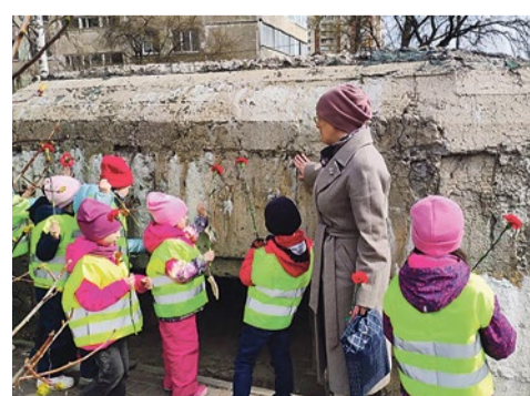
Районная акция «Гвоздика памяти»