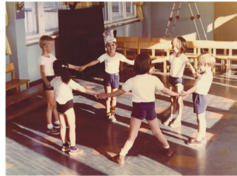
Физкультурное занятие, 1970-е годы.