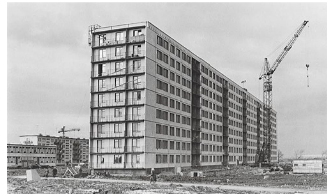
Первый дом 602-й серии – Пражская, 39. 1967 год

Первые домостроительные комбинаты были созданы в 1959 году, когда в СССР стартовала программа массовой жилищной застройки. Вокруг Ленинграда стали расти огромные микрорайоны, где каждый квартал возводился в соответствии с проектом детальной планировки города. В цехах домостроительных комбинатов делали все железобетонные детали зданий – эти плиты были прочнее и качественнее тех, что заливались в арматуру прямо на стройплощадке. Да и собирать дома было быстрее.