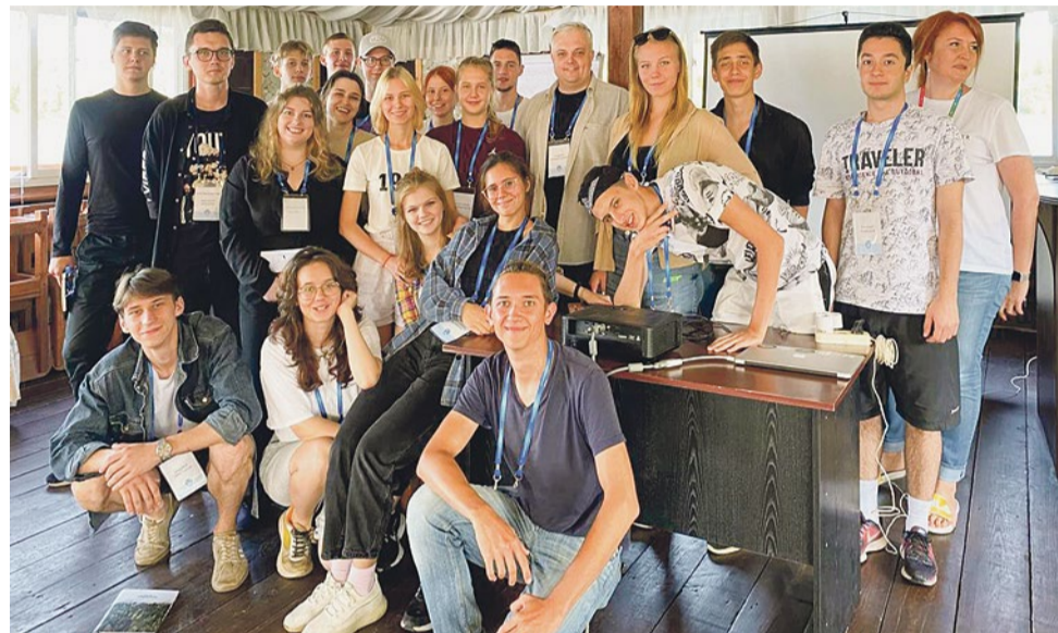
Команда Молодежного совета муниципалитета № 72

Кинопоказ прошел даже лучше ожиданий. Жители тепло нас приняли и сразу попросили показывать кино регулярно. А ребята впервые ощутили, что это такое – когда твоя идея обретает жизнь. Наверное, именно тогда мы поняли, что все возможно. К слову, уже осенью депутаты округа во главе