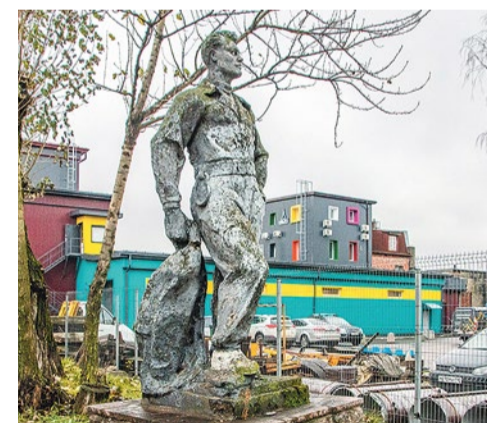
Памятник рабочему на бывшей территории ДСК-2