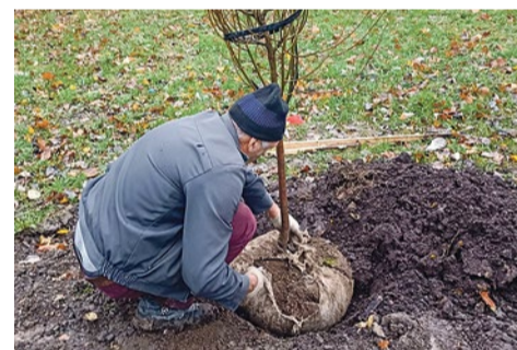
Посадка деревьев на Софийской улице, 39/3