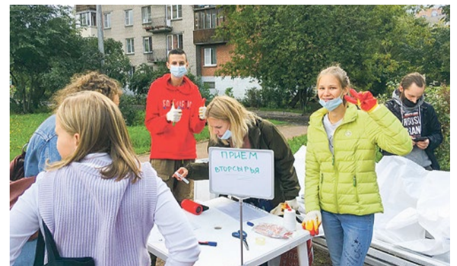
Молодежный совет на экопразднике