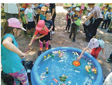
Экозанятие – чистка пруда от мусора

Родители приходят сюда на субботники. Заборчик на ясельной площадке сделал папа, чтобы малыши не разбегались. Площадку по мотивам сказок Пушкина