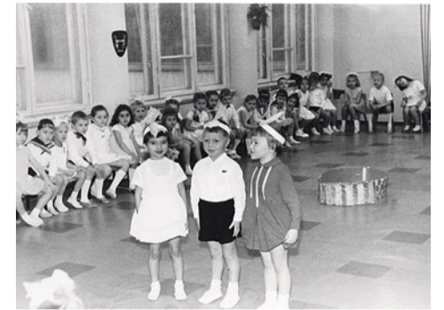
Первые воспитанники, 1970-е годы.

«Вокруг все очень переменчиво, но у нас свой мирок, и мы его очень бережем, охраняем. Мы как маленькая семья. Бабушки, которые в детстве ходили сюда, теперь водят к нам своих внуков. И сюда ходят дети и внуки многих наших сотрудников и бывших воспитанников».