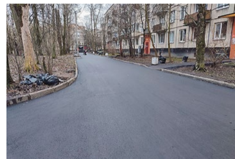
Замена асфальта на улице Турку, 32/4