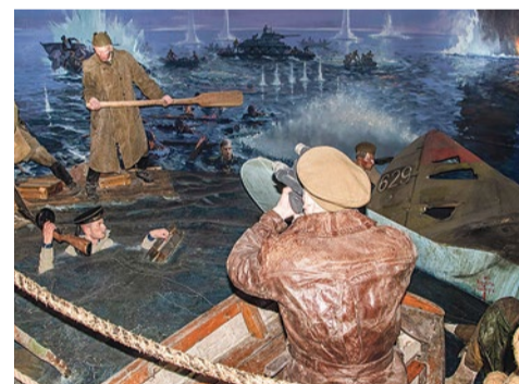
Выставка рассказывает о фронтовых киномеханиках, о работниках «Ленфильма»

«Очень сильно понравилось. Я под впечатлением, даже прослезилась. Я бывала на подобных выставках в Москве, но каждый раз узнаю что-то новое».