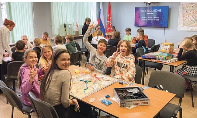
Настольные игры для детей и подростков

Узнать подробную информацию о мероприятиях и связаться с нами можно через группу «ВКонтакте»: vk.com/molsov72