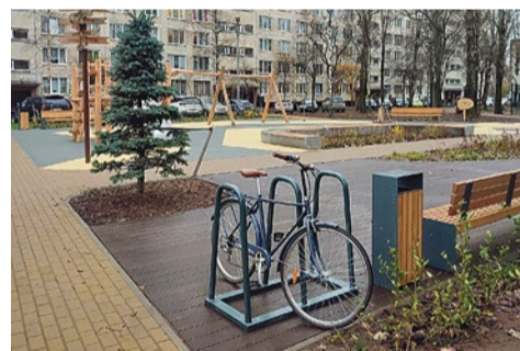
Велопарковка на детской площадке на Бухарестской улице, 86