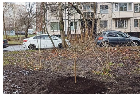
Посадка деревьев в зоне отдыха на Софийской улице, 35/4