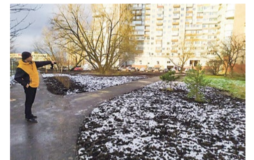
Благоустройство дорожек на Южном шоссе, 104